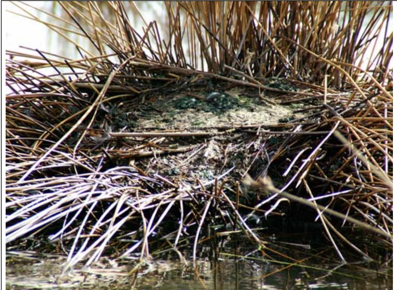
Abbozzo di nido di Cavaliere d'Italia ( Himantopus himantopus ) nella fascia settentrionale del lago di Pergusa