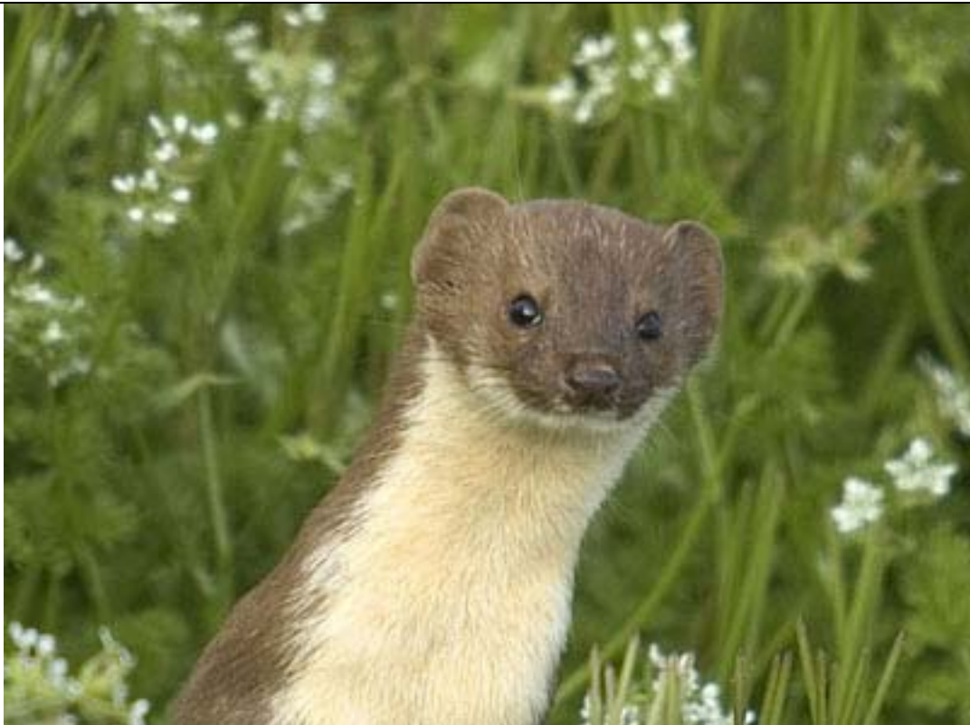
Donnola ( Mustela nivalis ), piccolo predatore di mammiferi ed uccelli, presente nella conca Pergusina.

Confermata la presenza di questo piccolo Mustelide.