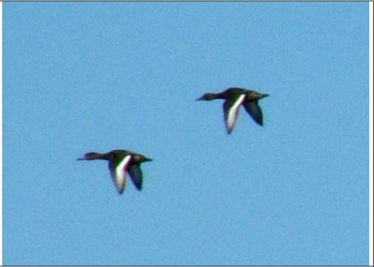
Moretta tabaccata ( Aythya nyroca ), specie globalmente minacciata, ritenuta prioritaria a livello europeo.