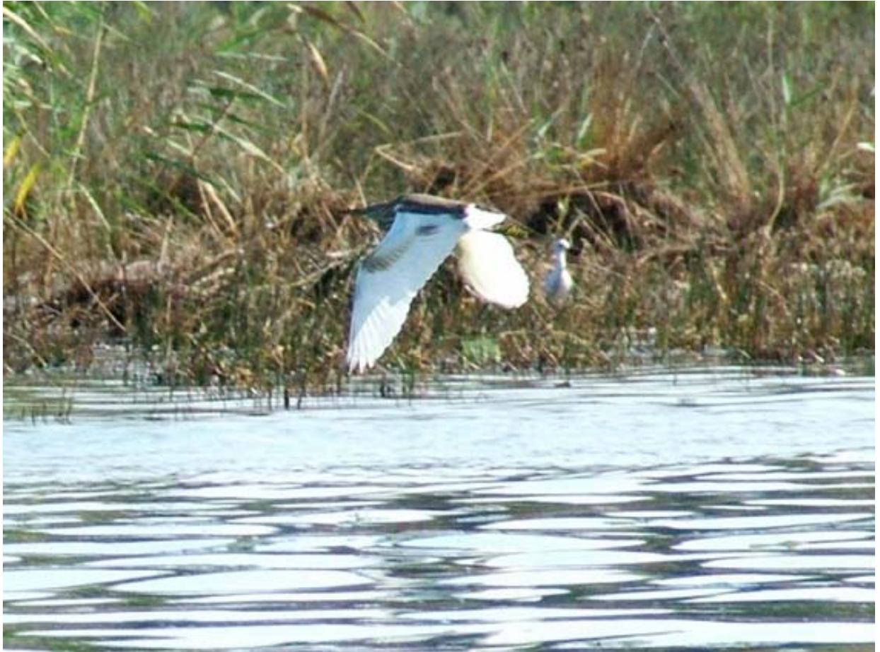
Individuo immaturo di Sgarza ciuffetto ( Ardeola ralloides ) in sosta nel lago di Pergusa.