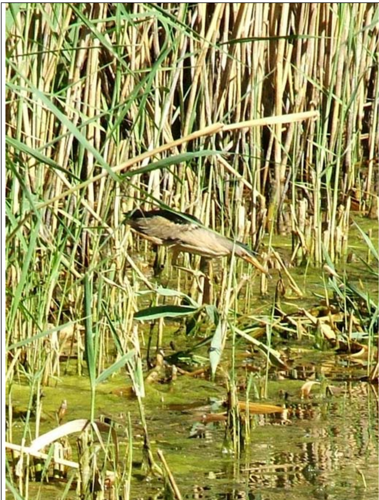
Tarabusino fotografato a Pergusa nella stagione riproduttiva 2005.