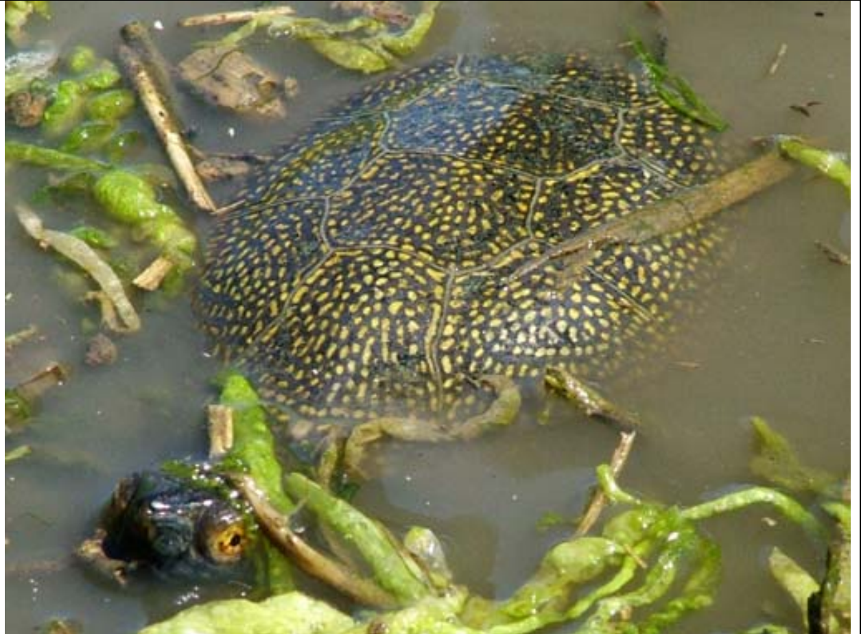
Testuggine palustre ( Emys trinacris ) fotografata nel Lago di Pergusa nella stagione estiva 2005 (R. Termine, com. pers.).